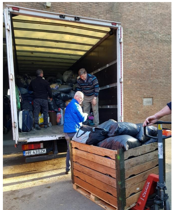
Totaal was dit ca 35m 3 en 6.000 kg aan gewicht.